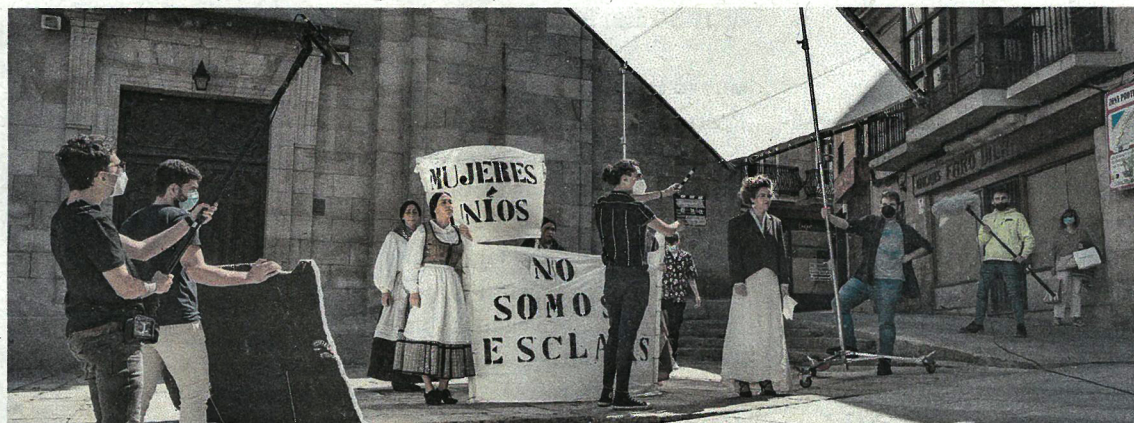
El falso tráiler de "Marilyn" montó su set de rodaje en el Casco Vello.