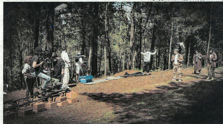
"Foresta", de Alexandre Domínguez, se rodó en el parque forestal de Beade.