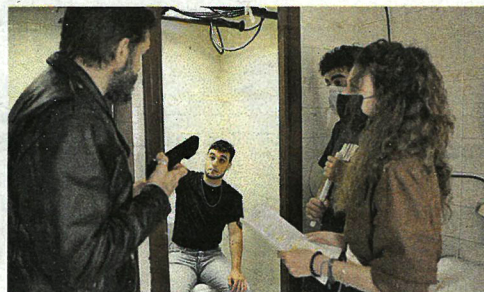
Una secuencia de "Quoridor", de Alberto García.